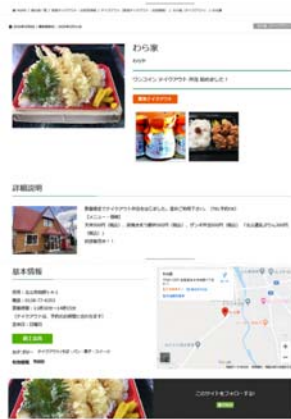
事業所 (店舗) 紹介ページ