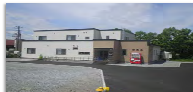
グループホーム「はあと」