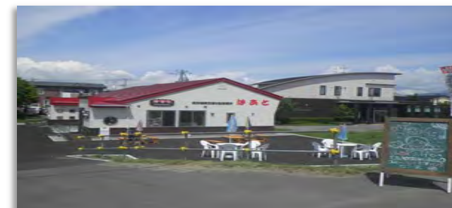
就労継続支援B型「はあとⅡ」 コミュニティカフェ「はあと&けやき」