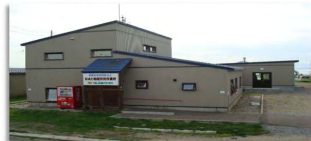
就労継続支援B型「はあとⅠ」 地域活動支援センター「はあと」